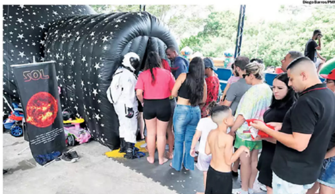
MAUÁ. Parque da Juventude receberá planetário itinerante, atividade gratuita que reúne lazer e ciência