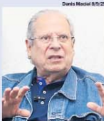
Darian Mascal 8/9/25

O ex-ministro da Casa Civil José Dirceu (PT-foto) retorna hoje a Mauá, desta vez ao diretório municipal do PT, a convite do secretário adjunto de Meio Ambiente e ex-vereador Rogério Santana (PT), para conversar sobre conjuntura política regional, nacional e internacional, além de debater propostas internas do petismo. A plenária está marcada para 19h, e deve reunir militantes, vereadores e deputados do partido. Essa é a segunda vez de José Dirceu na cidade em menos de um ano, já que visitou Mauá em agosto do ano passado.