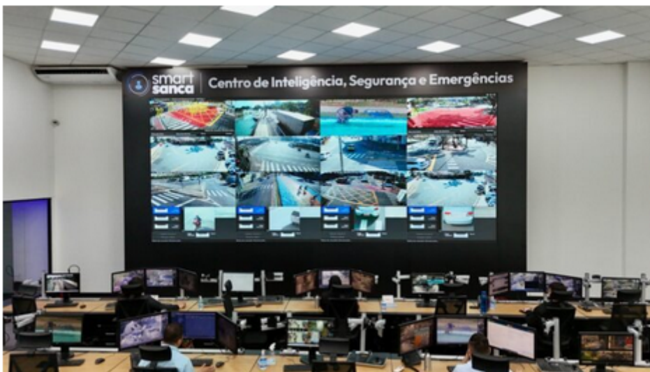
Smart Sanca

O Centro de Inteligência integra centenas de câmeras espalhadas por toda a cidade, operando 24 horas por dia com inteligência artificial capaz de detectar placas de veículos, comportamentos suspeitos e realizar identificação facial.