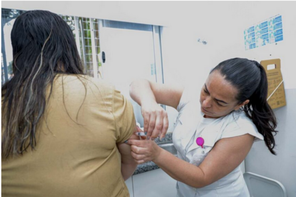
Eric Romero / PMSCS

Quem não participou da campanha não precisa se preocupar. Todas as vacinas do Calendário Nacional continuam disponíveis no Centro Municipal de Imunização e nas 14 UBSs (Unidades Básicas de Saúde) da cidade.