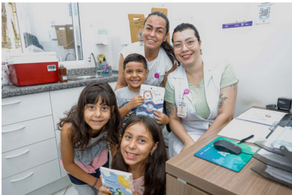
Eric Romero / PMSCS

Basta comparecer com documento pessoal e caderneta de vacinação para atualizar o cartão de imunização e garantir proteção contra diversas doenças.