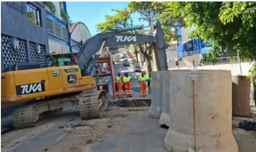
São Caetano inicia 2026 com obras pesadas contra enchentes na Rua Amazonas

Intervenções fazem parte do Programa Drenar e prometem fim dos alagamentos em via estratégica; conclusão total está prevista para julho.