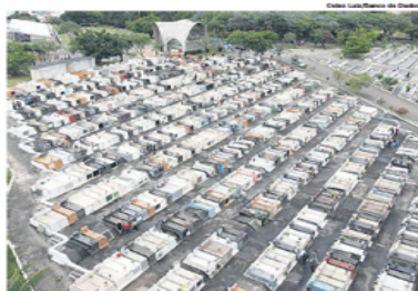
NA REGIÃO. Cemitério Curuçá, um dos locais que recebem os mortos