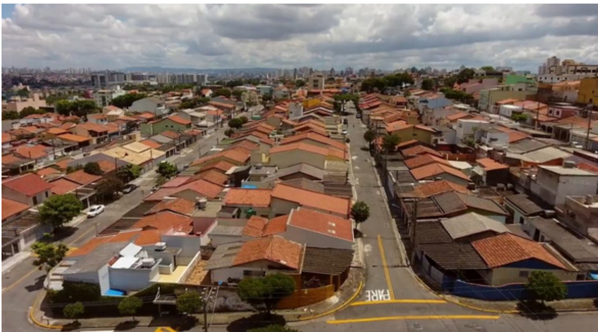
São Caetano do Sul, SP – cidade modelo em desenvolvimento urbano e qualidade de vida no Brasil.

A estação ferroviária local permite a integração direta com a rede de metrô nas estações Tamanduateí e Brás, facilitando o trajeto para qualquer ponto da capital paulista. Além disso, o sistema de ônibus municipais é integrado e cobre todos os bairros, garantindo mobilidade total para quem circula pela Princesinha do ABC. Essa cidade paulista se tornou a maior referência nacional em qualidade de vida e hoje é o destino mais desejado por quem busca tranquilidade