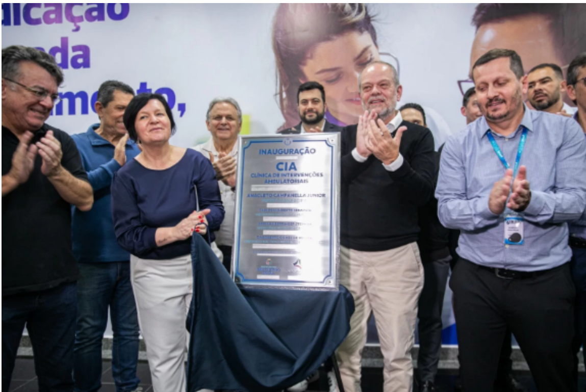
Prefeit00 de São Caetano, Tite Campanella, inaugura Clínica de Intervenções Ambulatoriais no Complexo Hospitalar.

O prefeito São Caetano, Tite Campanella, inaugurou nesta quarta-feira (19/12) a CIA (Clínica de Intervenções Ambulatoriais). O novo espaço, criado no pavimento térreo do Complexo Hospitalar de Clínicas, no Bairro Olímpico, visa otimizar a realização de procedimentos de baixa complexidade, liberando consultórios e leitos para casos de maior gravidade.