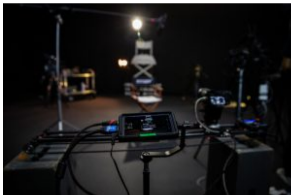
Estúdio Instituto Criar de TV e Cinema e Novas Mídias (1)

São 10 meses de formação, ao longo de 2026, com aulas de segunda a sexta-feira, das 9h às 17h, no bairro do Bom Retiro, em São Paulo. O curso abrange os principais eixos de criação e realização audiovisual, contemplando as áreas de Animação, Assistência de Direção, Áudio, Direção de Arte: Figurino e Caracterização, Direção de Arte: Cenografia, Fotografia, Produção, Pós-Produção e Roteiro.