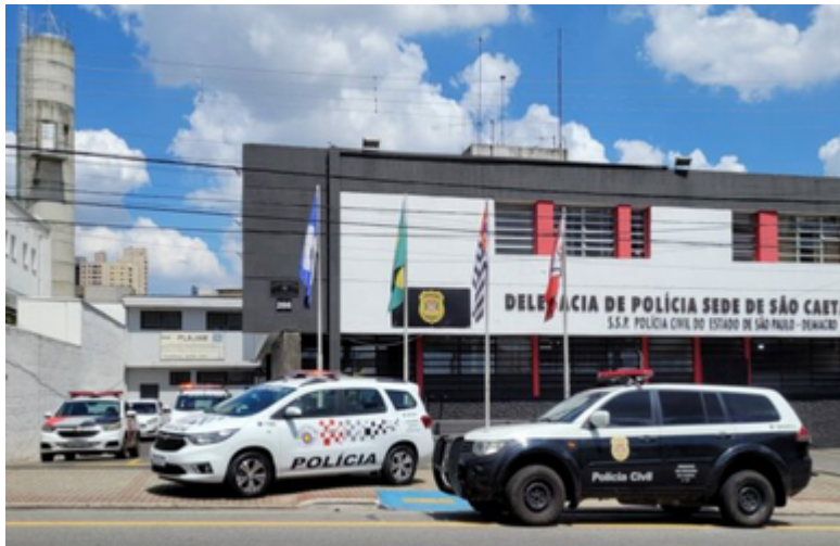
Delegacia Sede de Polícia em São Caetano

A Operação Bloqueio é uma ação estratégica coordenada pela SESEG (Secretaria Municipal de Segurança) e realizada pela GCM, com o objetivo de prevenir crimes patrimoniais, reforçar o patrulhamento, identificar irregularidades e aumentar a percepção de segurança em diversos pontos da cidade. Durante a ação, são realizadas fiscalizações de veículos, checagem documental, abordagens preventivas e cumprimento das leis de trânsito.