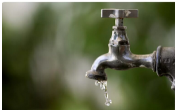
— São Caetano entra no racionamento de água da Sabesp Foto: Divulgação/Sabesp

São Caetano entra no racionamento de água da Sabesp Foto: Divulgação/Sabesp