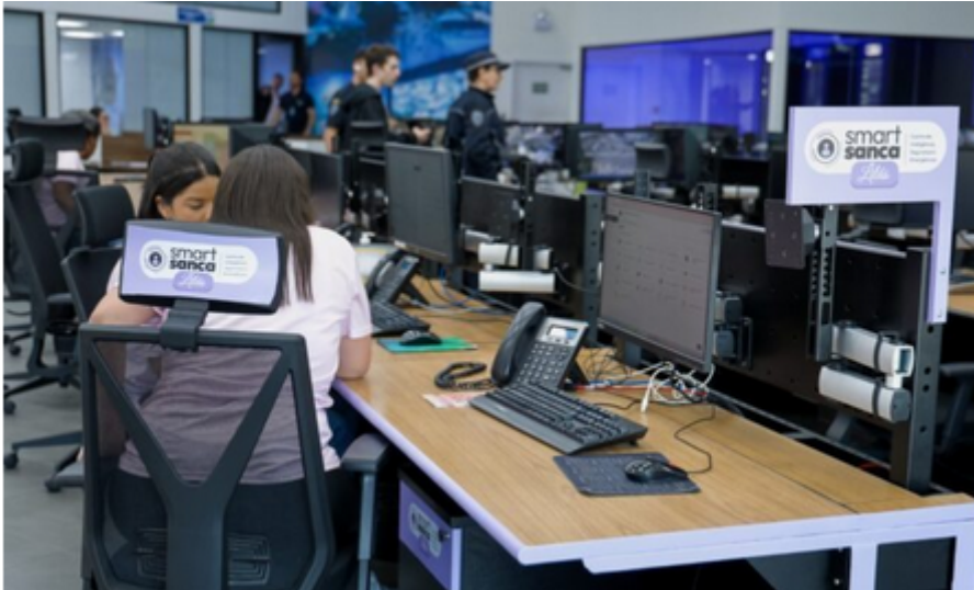
São Caetano inaugura Smart Sanca Lilás para atender vítimas de violência doméstica

O coração do novo centro é a Cabine Lilás, um ambiente preparado para escuta qualificada e acolhimento humanizado. Este espaço garante privacidade e suporte imediato às mulheres que buscam ajuda.