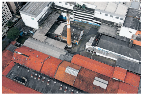
SÃO CAETANO. Comprada pela Cacau Show em 2023, área da Pan segue com indefinições após falência

no Interior de São Paulo chegou a R$ 2 bilhões, com as promessas de oferecer mais de 100 atrações e a maior montanha-russa da América Latina.