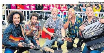
ARRETADO. Forró do Peixelétrico é uma opção

compilado de oito composições assinadas pelo músico que flertam com a música brasileira, referências como Hermeto Pascoal e Arrigo Barnabé, com o jazz americano e sua contribuição na parte da improvisação musical. Contém