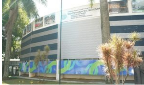
Fachada da Fundação Pró-Memória de São Caetano do Sul e Pinacoteca Municipal.