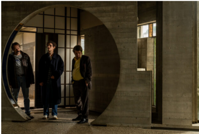
Altivole (TV) 28/10/2024 Via Brioni, 31030. Fai memoriale Tomba Brion. foto di scena del film "le città di pianura" di Francesco Sossal.

Acesse a seleção completa de filmes do Festival de Cinema Italiano 2025 em: www.festivalcinemaitaliano.com .