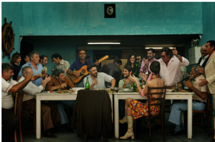
Hey Joe

Até o dia 12 de novembro, o 20º Festival de Cinema Italiano no Brasil está em cartaz no CineTeatro Santos Dumont, em São Caetano, com sessões gratuitas de produções de destaque da cinegrafia italiana: dos clássicos aos recém-lançados, a programação é formada por longas-metragens de grandes diretores da dramaturgia italiana e mundial.