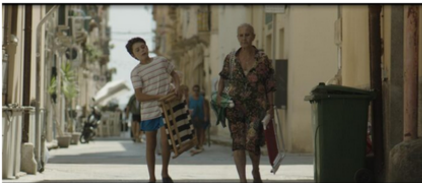
Gioia Mia Verano na Sicilia é exibido no CineTeatro Santos Dumont