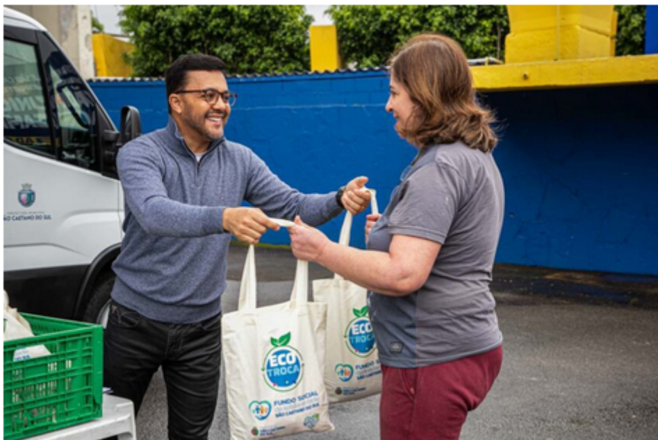
Gabriela Gonçalves / PMSCS

Nesta rodada específica do projeto itinerante, o sucesso da mobilização popular resultou na entrega de 330 sacolas recheadas de alimentos. Em contrapartida, os moradores devolveram aproximadamente 600 kg de materiais recicláveis e cerca de 100 litros de óleo de cozinha usado. Este é um exemplo notável do duplo benefício do EcoTroca: enquanto garante o descarte correto de resíduos que poluiriam o meio ambiente, contribui diretamente para a qualidade de vida e a segurança alimentar de famílias em situação de vulnerabilidade.