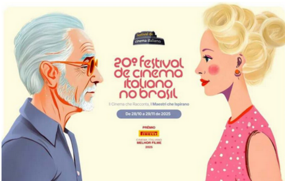
Reprodução 20º Festival de Cinema Italiano no Brasil

A programação do Festival de Cinema Italiano segue o mote da 20ª edição: “Il cinema che racconta, i maestri che ispirano” (“O cinema que conta, os mestres que inspiram”). A proposta é equilibrar o peso da história com a força da produção contemporânea.