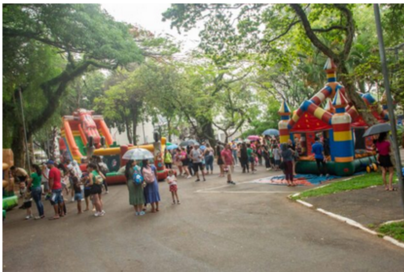
Atrações do Dia de Brincar 2025

Em São Caetano do Sul, o 12 de outubro é Dia de Brincar. Crianças de todas as idades irão embarcar no mundo da diversão com muita música, dança, contação de histórias, oficinas artísticas e brincadeiras, tudo preparado especialmente para a garotada.