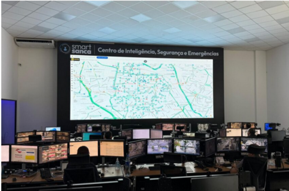
Smart Sanca ganha reforço de 51 câmeras

Os equipamentos são de condomínios, casas e comércios de diferentes bairros de São Caetano, entre eles Oswaldo Cruz, Santo Antônio, Santa Paula e Olímpico. Há ainda mais 50 pedidos de inclusão no sistema de outros estabelecimentos comerciais ou residências – esses estão em fase de análise técnica.