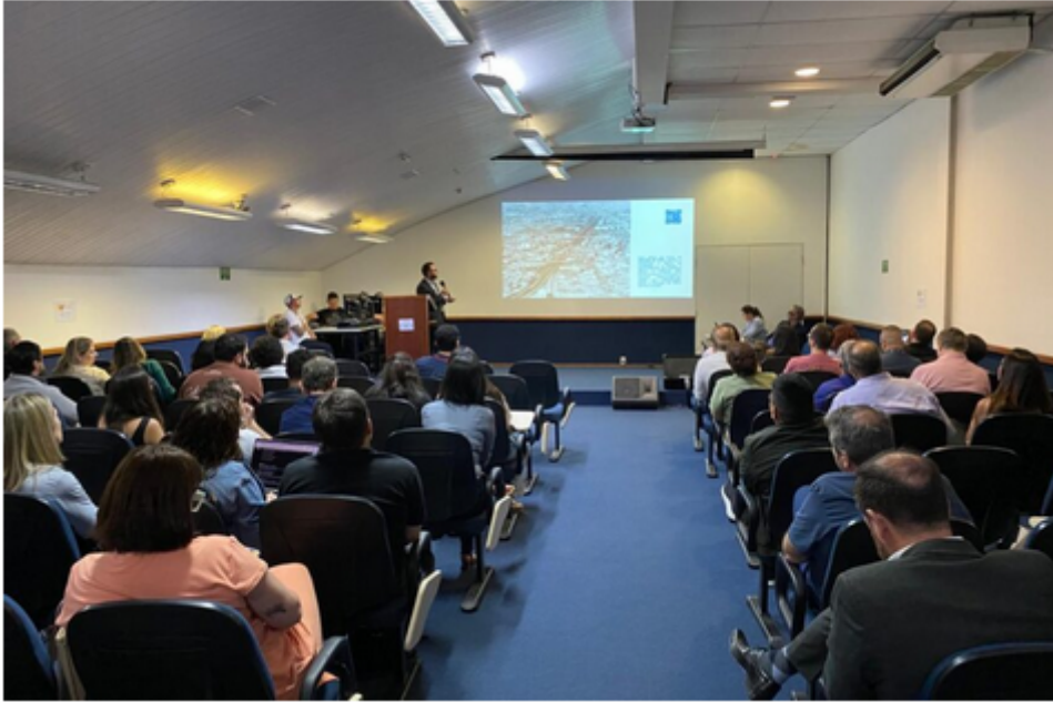
Evento contou com cerca de 150 participantes – Foto: Lucas Veloso (USCS)

O PDE define de que forma a cidade pode crescer, se desenvolver e se organizar, orientando políticas públicas, investimentos e o uso do solo. Conforme o Estatuto da Cidade (Lei Federal nº 10.257/2001), esse planejamento deve ser revisado a cada dez anos. Em São Caetano, o PDE vigente (2016–2025) está em fase de atualização para o período 2026-2035.