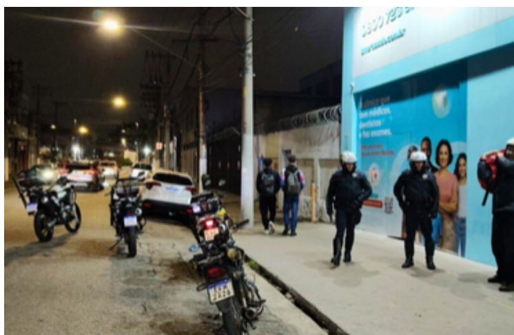
Operação Divisa Segura

A operação teve início no cruzamento da Avenida Goiás com Avenida Guido Aliberti, em São Caetano, e conta com 125 agentes e 55 viaturas das duas guardas civis. As ações incluem patrulhamentos táticos, bloqueios rápidos e abordagens sistemáticas a veículos e pedestres em atitude suspeita. A Polícia Militar também dá suporte às atividades, que têm previsão de se estender até domingo.