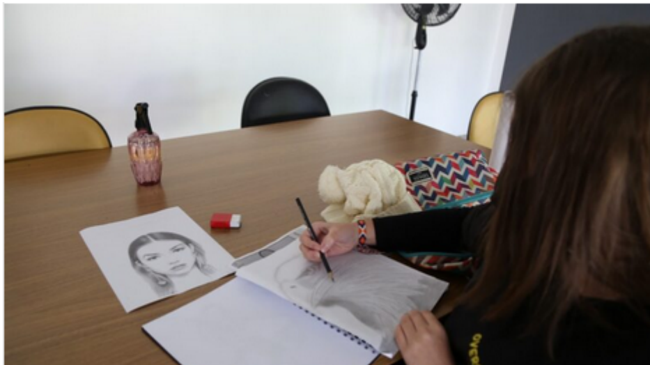
Oficina de desenho artístico.

A Prefeitura de São Caetano do Sul, via Secretaria Municipal de Cultura, recebe inscrições, de 8 a 12 de setembro, para cursos – novos e com vagas remanescentes – pelo programa Oficinas Culturais, organizado pela pasta. São 17 cursos livres, com aulas presenciais gratuitas, em diversas modalidades – de danças a técnicas para diferentes tipos de artesanatos, passando pelo desenho artístico, escrita, flauta doce, teatro 60+ e zumba. Todas as oficinas serão ministradas no segundo semestre de 2025.