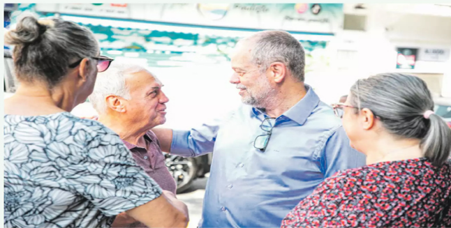
Com 67,6% de aprovação, o chefe do Executivo municipal é reconhecido pela população como trabalhador, competente e corajoso, além de ter a gestão avaliada positivamente em áreas como Saúde, Educação e Segurança

Destaque para o Smart Sanex - Centro de Inteligência, Segurança e Emergências, que