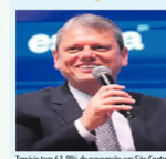
Tarcísio tem 61,9% de aprovação em São Caetano

Tarcísio é aprovado pela maioria; Lula, rejeitado