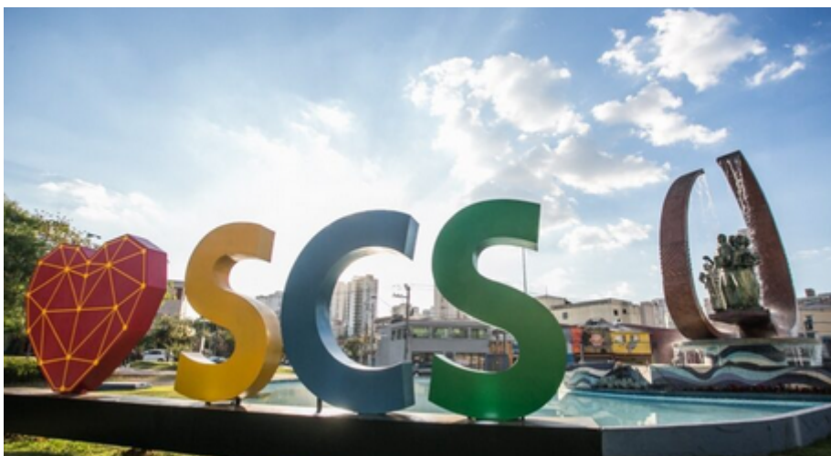
São Caetano do Sul

O atual cenário econômico brasileiro é desafiador e, no âmbito municipal, desde o início do ano a Prefeitura de São Caetano do Sul encarou a necessidade de estabelecer medidas de restrição orçamentária para o saneamento das contas públicas. Mas graças ao empenho de todas as secretarias, em particular da Seged, Secretaria Municipal de Gestão e Governo Digital, esse desafio tem sido vencido passo a passo.