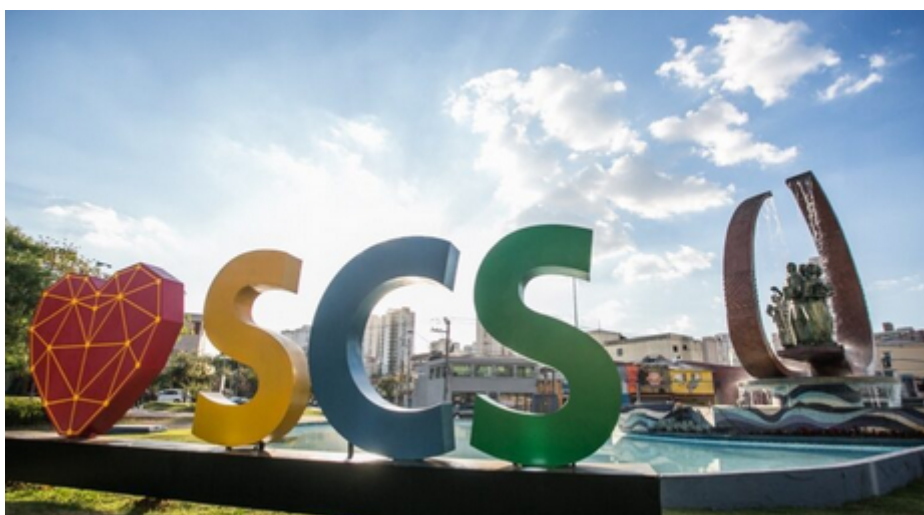
São Caetano do Sul

O atual cenário econômico brasileiro é desafiador e, no âmbito municipal, desde o início do ano a Prefeitura de São Caetano do Sul encarou a necessidade de estabelecer medidas de restrição orçamentária para o saneamento das contas públicas. Mas graças ao empenho de todas as secretarias, em particular da Seged, Secretaria Municipal de Gestão e Governo Digital, esse desafio tem sido vencido passo a passo.