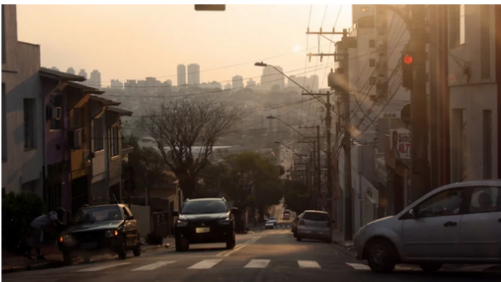
São Caetano do Sul

A cidade que mais cresce no Brasil impressiona com sua tranquilidade