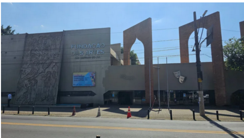
Fundação das Artes, São Caetano do Sul

A cidade que mais cresce no Brasil impressiona com sua tranquilidade