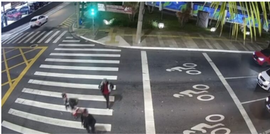
Jovem é espancado por grupo após discussão em escola estadual de São Caetano.

Um jovem de 19 anos foi brutalmente agredido por um grupo de aproximadamente 10 pessoas em São Caetano do Sul, na Grande São Paulo. A Polícia Civil investiga a possibilidade de o ataque ter sido motivado por racismo. A vítima, que foi emboscada em uma praça após uma discussão na Escola Estadual Bonifácio de Carvalho Coronel, está internada em uma Unidade de Terapia Intensiva (UTI).