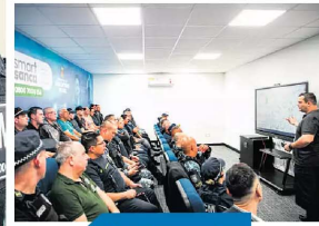
Alta tecnologia empregada no Smart Sanca, além de conexão com bancos de dados, permite identificar pessoas e veículos.