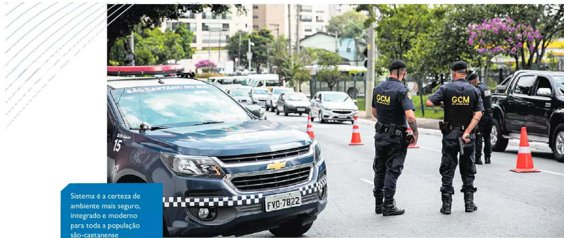
Sistema é a certeza de ambiente mais seguro, integrado e moderno para toda a população são-caetanense.