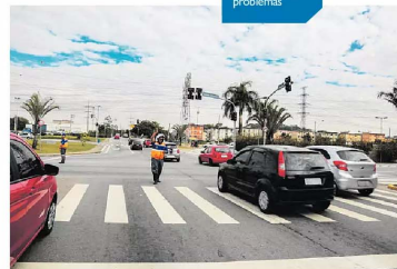
Smart Sanca monitora em tempo real avenidas, ruas e cruzamentos pela cidade, além de alertar sobre problemas.

Produção Distrito do Grande ABC DIÁRIO DO GRANDE ABC