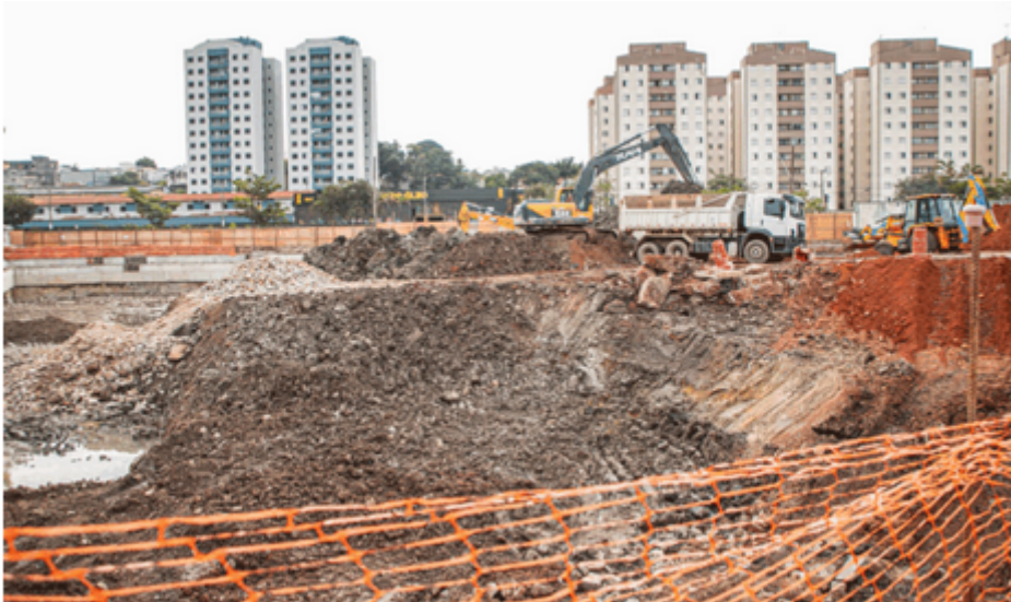
Instalação de tirantes de estabilidade marca nova fase do Piscinão do Fundação em São Caetano

A construção do Piscinão do Bairro Fundação, dentro do Programa Drenar São Caetano, segue dentro do cronograma e um dos marcos importantes desse avanço é a finalização da instalação de 95% das vigas de coroamento — estrutura responsável por unificar as lamelas que formam as paredes de contenção do reservatório. Os 5% restantes serão concluídos apenas ao final da obra, pois servem, neste momento, como passagem estratégica para o deslocamento de máquinas e equipamentos.