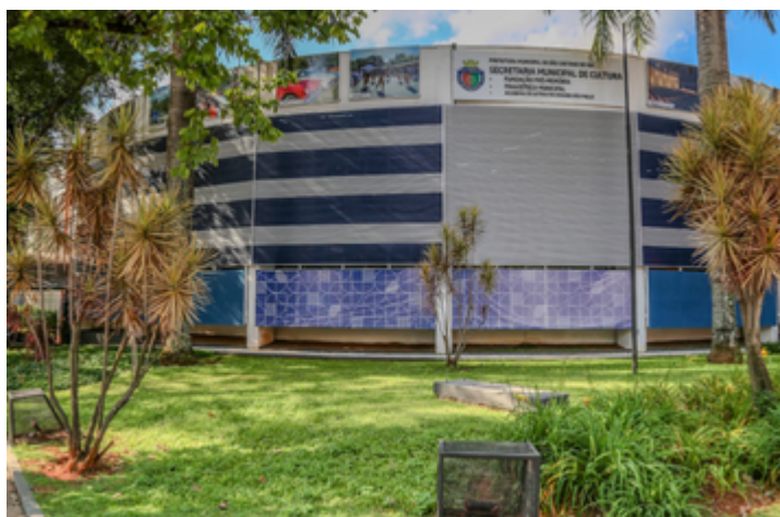
Paulo Cesar Ribeiro/Secult PMSCS

Inaugurada em 1991, a Pinacoteca Municipal de São Caetano ocupa o piso superior do prédio da Fundação Pró-Memória e reúne um acervo artístico de mais de 400 obras, incluindo pinturas, gravuras, esculturas e fotografias. O espaço se destaca por sua proposta cultural aberta à arte contemporânea e por sua missão de preservar o patrimônio artístico local.