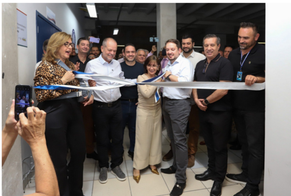
USCS inaugura Centro de Inovação INOVA USCS para o Desenvolvimento Regional.

Foi inaugurado hoje (6/5) o Centro de Inovação INOVA USCS para o Desenvolvimento Regional, projeto constituído pela tríade Prefeitura Municipal de São Caetano do Sul, Universidade Municipal de São Caetano do Sul (USCS) e Fundação de Apoio à USCS (FAUSCS). O Centro funcionará nas dependências do Campus Centro da USCS (Rua Santo Antônio, 50), no 5º andar.