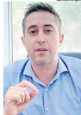
SALGADO: "Estamos estruturando"