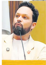
ANANIAS: "Assunto carece de atenção"