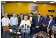
Unificação do região na entidade foi resultado pelos gestores, que agora esperam que não haja mais movimentos que interrompam o processo

Quase 35 anos após sua fundação, o Consórcio Intermunicipal Grande ABC teve nesta terça-feira (01/04), a sua primeira reunião com oito cidades consorciadas. O encontro dos prefeitos é o primeiro após o retorno de São Caetano. A Assembleia realizada em Santo André teve em sua pauta a integração da segurança pública da região, o debate sobre a reforma tributária, ações ambientais e o debate sobre a drenagem, um dia após o temporal que causou problemas em Mauá, Santo André, São Bernardo e São Caetano.