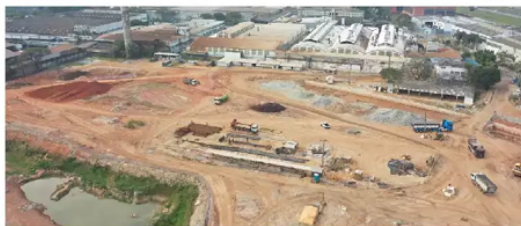
A Secretaria de Meio Ambiente realiza uma vistoria hoje no Piscinão Jaboticabal, uma das principais obras

Ainda segundo Jacomussi, um dos pontos mais críticos de Mauá