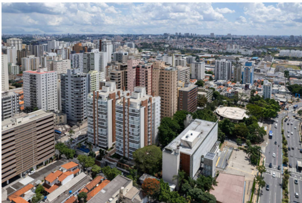
Vista de prédios no bairro Santa Paula, em São Caetano do Sul (SP) - Eduardo Knapp - 22.fev.24/Folhapress

São Caetano do Sul, no ABC Paulista, mostrou a maior proporção de habitantes com ensino superior completo entre os municípios brasileiros com população acima de 100 mil pessoas em 2022.