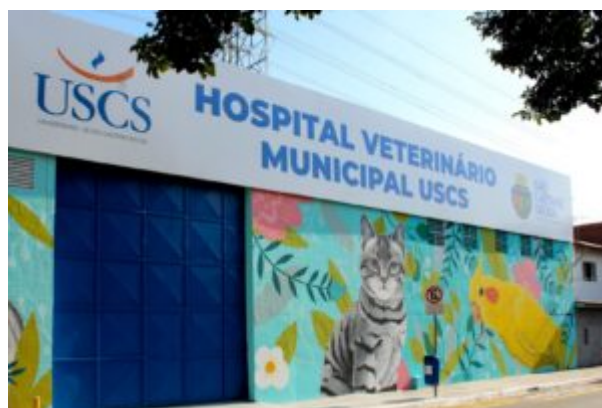
Hospital Veterinário USCS

O Hospital Veterinário Universitário Municipal São Lázaro, fruto de parceria entre a Secretaria Municipal de Saúde de São Caetano do Sul e a Universidade Municipal de São Caetano do Sul (USCS) realizou, no ano de 2024, um total de 14.778 atendimentos a cães, gatos e pets não convencionais. Inaugurado em março de 2023, o primeiro hospital veterinário público do ABC realiza atendimentos clínicos e cirúrgicos de cães e gatos e pets não convencionais, além de exames de imagem (ultrassonografia e raio-X) e laboratoriais.