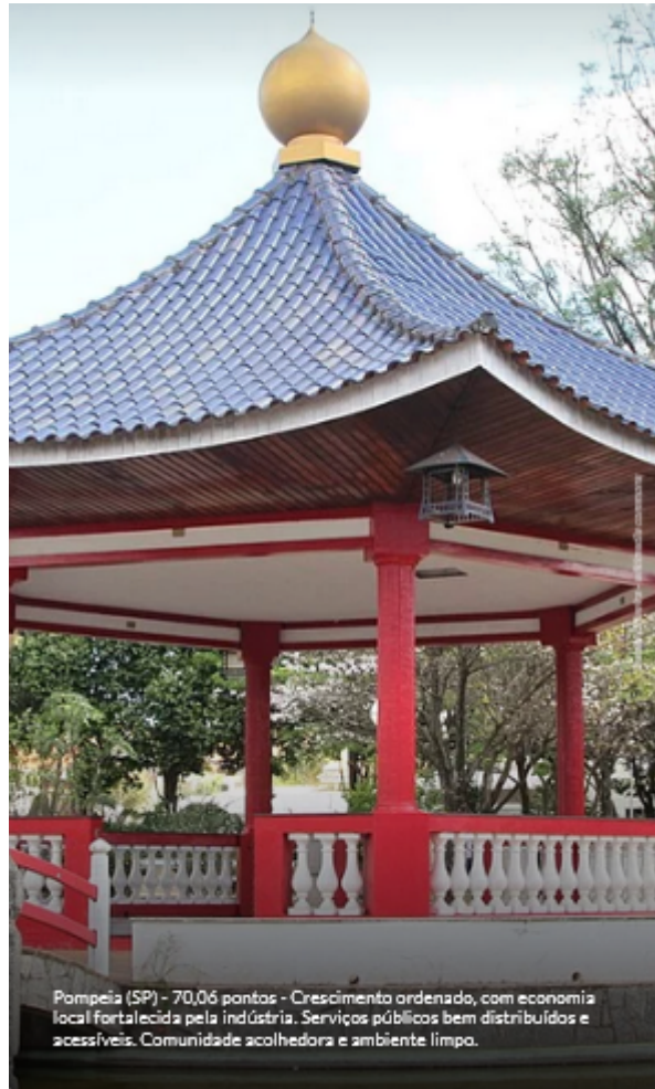
Pompeia (SP) - 70,06 pontos - Crescimento ordenado, com economia local fortalecida pela indústria. Serviços públicos bem distribuídos e acessíveis. Comunidade acolhedora e ambiente limpo.