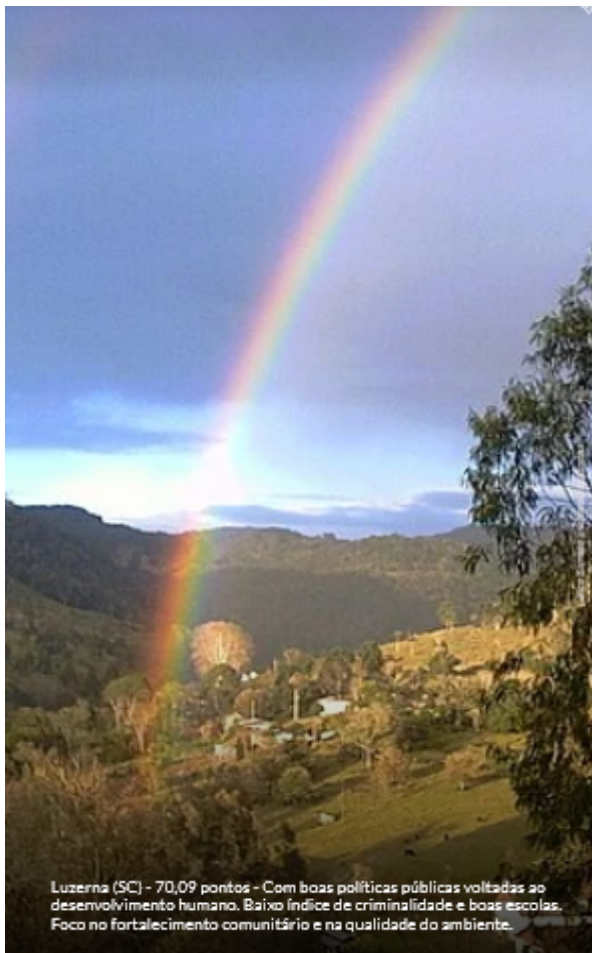
Luzerna (SC) - 70,09 pontos - Com boas políticas públicas voltadas ao desenvolvimento humano. Baixo índice de criminalidade e boas escolas. Foco no fortalecimento comunitário e na qualidade do ambiente.