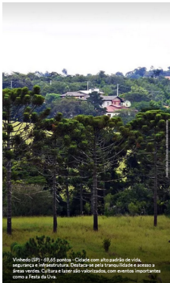
Vinhedo (SP) - 69,65 pontos - Cidade com alto padrão de vida, segurança e infraestrutura. Destaca-se pela tranquilidade e acesso a áreas verdes. Cultura e lazer são valorizados, com eventos importantes como a Festa da Uva.