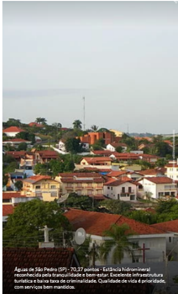
Águas de São Pedro (SP) - 70,37 pontos - Estância hidromineral reconhecida pela tranquilidade e bem-estar. Excelente infraestrutura turística e baixa taxa de criminalidade. Qualidade de vida é prioridade, com serviços bem mantidos.