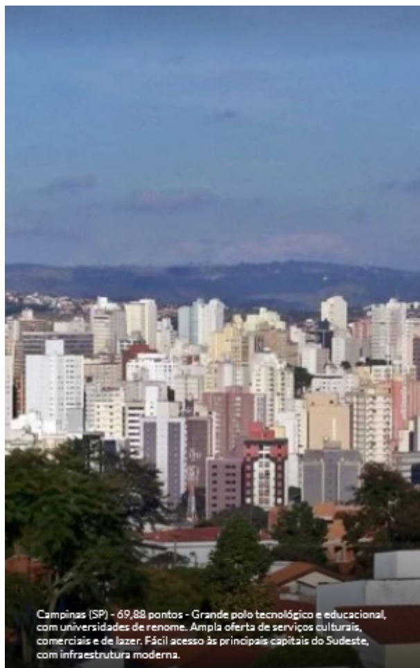
Campinas (SP) - 69,88 pontos - Grande polo tecnológico e educacional, com universidades de renome. Ampla oferta de serviços culturais, comerciais e de lazer. Fácil acesso às principais capitais do Sudeste, com infraestrutura moderna.