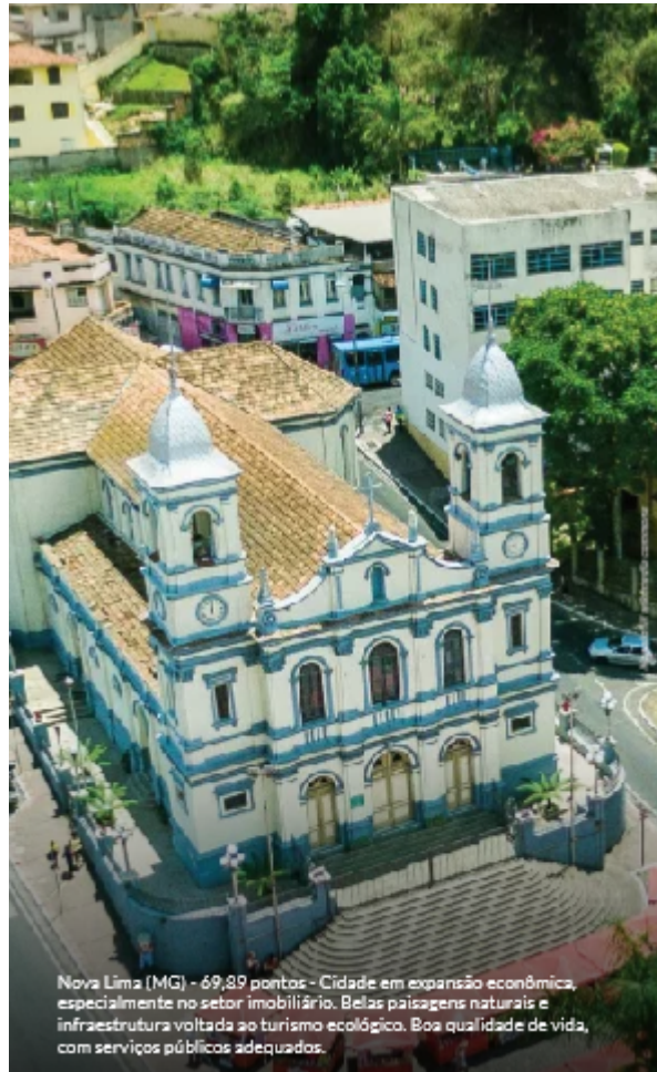
Nova Lima (MG) - 69,89 pontos - Cidade em expansão econômica, especialmente no setor imobiliário. Belas paisagens naturais e infraestrutura voltada ao turismo ecológico. Boa qualidade de vida, com serviços públicos adequados.