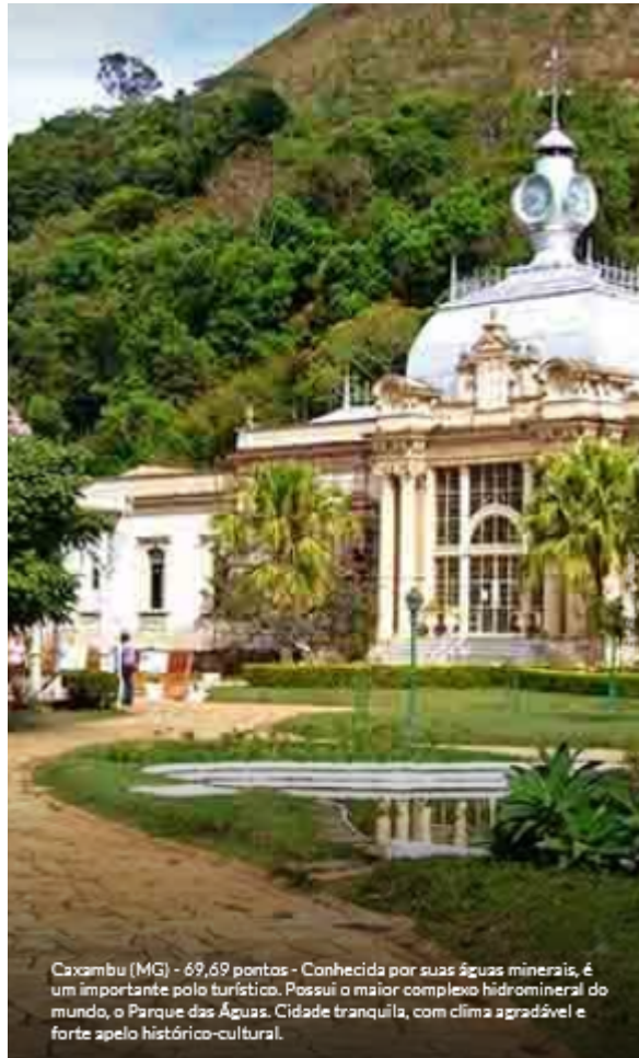
Caxambu (MG) - 69,69 pontos - Conhecida por suas águas minerais, é um importante polo turístico. Possui o maior complexo hidromineral do mundo, o Parque das Águas. Cidade tranquila, com clima agradável e forte apelo histórico-cultural.