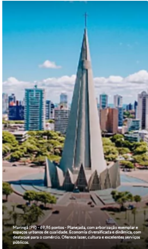
Maringá (PR) - 69,96 pontos - Planejada, com arborização exemplar e espaços urbanos de qualidade. Economia diversificada e dinâmica, com destaque para o comércio. Oferece lazer, cultura e excelentes serviços públicos.