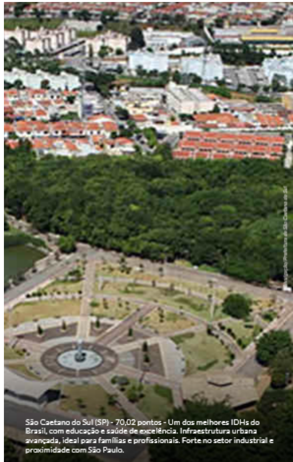
São Caetano do Sul (SP) - 70,02 pontos - Um dos melhores IDHs do Brasil, com educação e saúde de excelência. Infraestrutura urbana avançada, ideal para famílias e profissionais. Forte no setor industrial e proximidade com São Paulo.