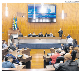
STOANDRÉ. Quatro vereadores deixaram suas cadeiras na Câmara