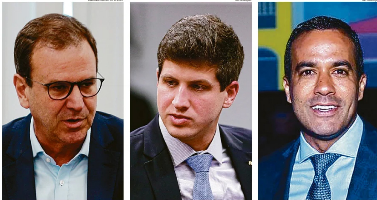
Rio: Paes anunciou a criação de uma nova força de segurança Recife: Campos propõe debate sobre armamento da Guarda Salvador: Bruno Reis prometeu Plano Municipal de Segurança