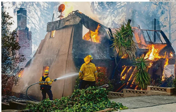
Aquecimento global. Bombeiros combatem o fogo em um dos grandes incêndios que devastam áreas de Los Angeles, na Califórnia: aumento da temperatura

Como 1,6°C acima, a temperatura média global chegou a