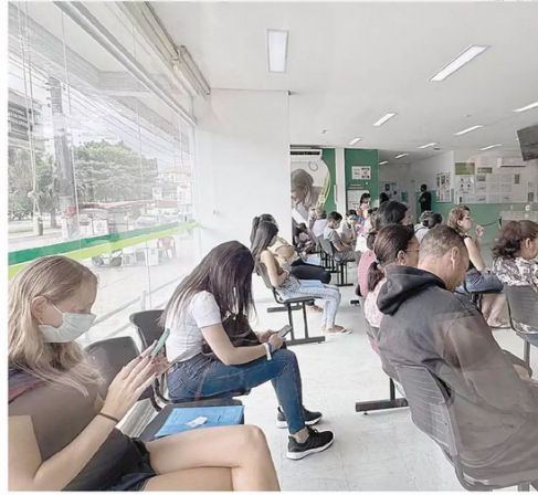
Unidade de Pronto Atendimento (UPA) Zona Leste, no Estuário, em Santos: número de pacientes menor

Em Santos, entre o dia 1º e meio-dia de ontem,