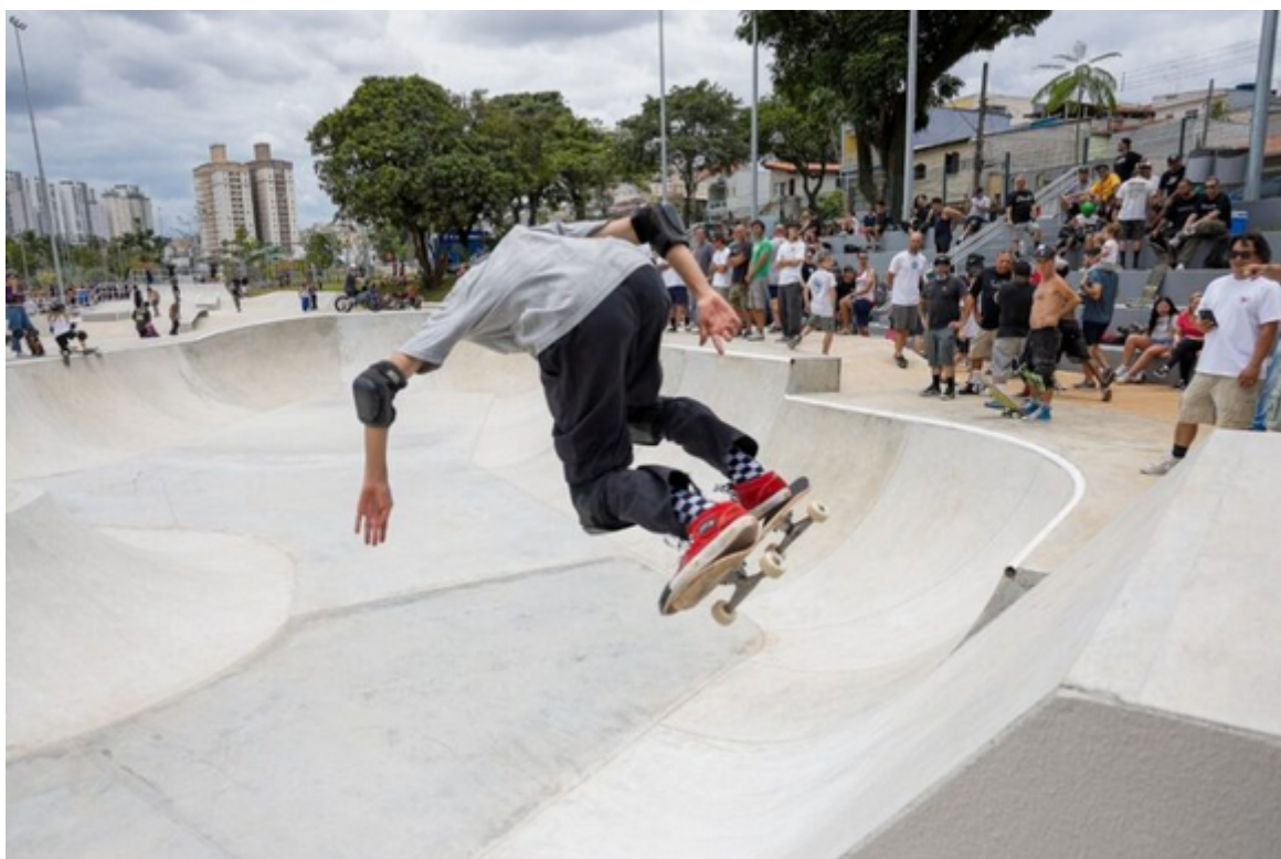
Equipamento de lazer conta com uma extensa pista de skate.

Em homenagem a um dos maiores atletas da história brasileira, o parque linear foi denominado Parque Municipal Edson Arantes do Nascimento – Rei Pelé. Paralelo à Avenida Presidente Kennedy e conectado ao Parque Cidades das Crianças, oferece ao morador de São Caetano cerca de 60 mil m 2 de lazer, esporte, cultura e gastronomia em um só local, com infraestrutura completa para atender milhares de pessoas diariamente. Do evento de inauguração, que contou com apresentação da Bamascs (Banda Marcial Municipal de São Caetano do Sul), calcula-se que tenham participado mais de 7 mil pessoas.