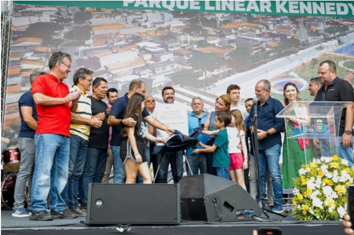
Em homenagem a um dos maiores atletas da história brasileira, o parque linear foi denominado Parque Municipal Edson Arantes do Nascimento – Rei Pelé.

O projeto reflete a visão da Administração em alinhar a cidade ao conceito de “cidade para as pessoas”, promovendo qualidade de vida em áreas densamente urbanizadas e com pouca disponibilidade de terrenos livres.