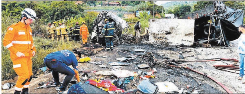
PERTENCEN DOS PASSAGEIROS E DESTROÇOS DOS VEÍCULOS SE ESPALHARAM PELA RODOVIA, QUE FICOU INTERDITADA DURANTE PARTE DO DIA DE ONTEM