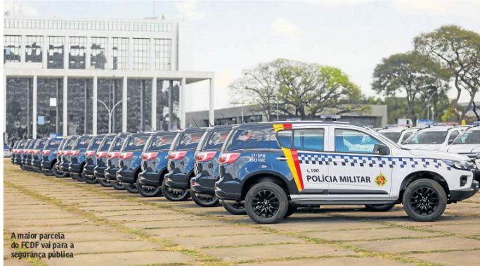
A maior parcela do FCDF vai para a segurança pública

O deputado Alberto Fraga (PL-DF) também salientou que o trabalho em conjunto foi crucial. "É importante dizer que foi uma ação de todos, não teve nenhum salvador da pátria, não foi uma emenda individual que salvou, foi uma conversa feita por todos, inclusive pela nossa vice-governadora (Celina Leão), que esteve presente aqui no plenário. Agora, esperamos que não haja mais outra tentativa do governo de prejudicar o Distrito Federal", disse.