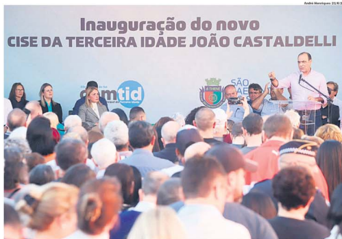
AURICCHIO. Discursa para moradores e apoiadores durante inauguração do Cise da Terceira Idade

A PESQUISA O Instituto Paraná Pesquisas entrevistou 715 moradores. O grau de confiança da pesquisa é de 95%, o que significa dizer que, se o levantamento foi realizado 100 vezes, em 95 deles o resultado será o mesmo. Ainda segundo a pesquisa, as maiores taxas de aprovação ao governo Auricchio entre a população são-caetanense encontram-se entre homens (70,6%), moradores de 60 anos ou mais (73,2%), com ensino fundamental (79,2%) e entre a população economicamente não ativa (70,3%). No sentido contrário, os maiores índices de reprovação podem ser observados entre homens (26,7%), moradores de 16 a 24 anos (29,2%), com ensino superior (29,3%) e economicamente ativos (26,0%).