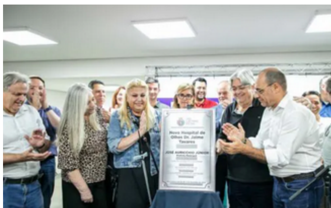
Hospital de Olhos Dr. Jaime Tavares

O Hospital de Olhos realiza cerca de 5.310 atendimentos por mês, entre consultas, exames e outros procedimentos