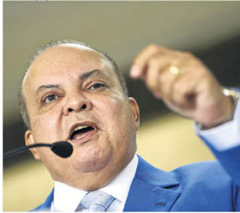
Ibaneis diz que usará amizades para convencer parlamentares