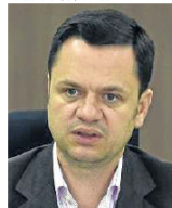
Anderson Gustavo Torres, ex-ministro da Justiça e ex-secretário da SSP-DF