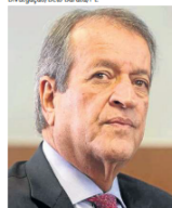
Valdemar Costa Neto, presidente do PL, partido de Bolsonaro