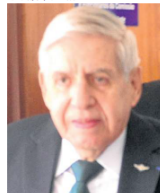
Augusto Heleno, general, ex-chefe do Gabinete de Segurança Institucional (GSI)