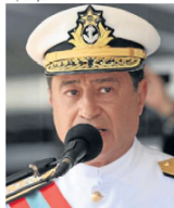
Almirante Almir Garnier Santos, comandante da Marinha na gestão Bolsonaro