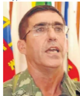
Estevam Cals Theophilus Gaspar de Oliveira, ex-chefe do Coter, divisão do Exército