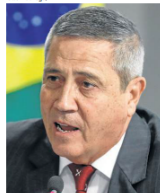
Braga Netto, general, ex-ministro da Defesa e vice de Bolsonaro na chapa em 2022