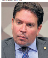
Alexandre Ramagem, ex-diretor da Agência Brasileira de Inteligência (Abin)