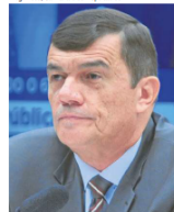
Paulo Sérgio Nogueira, ex-ministro da Defesa e ex-comandante do Exército